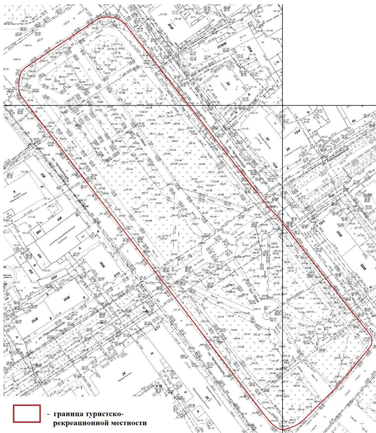
СХЕМА границ туристско-рекреационной местности «Демидовский сквер»